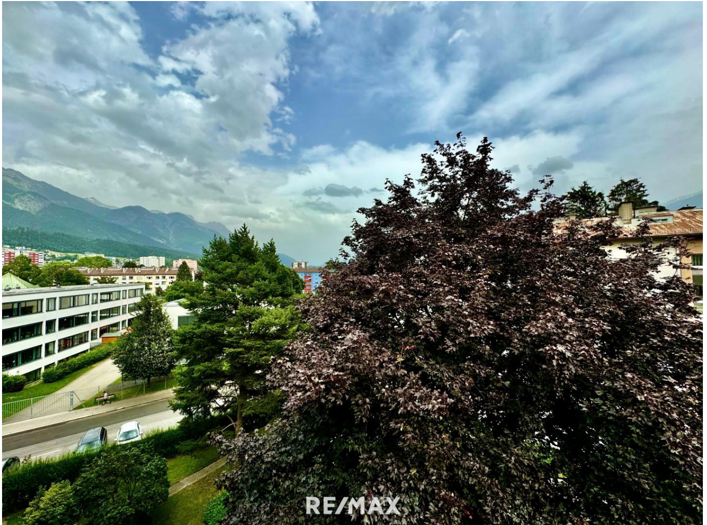
Aussicht von der Terrasse