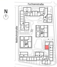
Lageplan ohne Maßstab