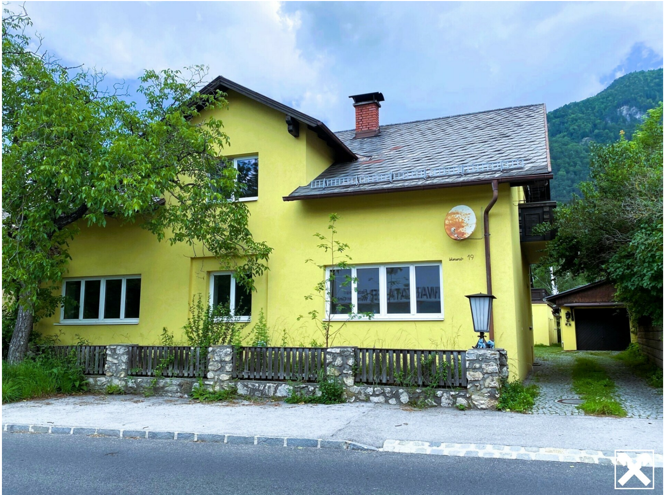
Straßenfront und Einfahrt

Sicheres Investment! Ab sofort Mieteinnahmen!