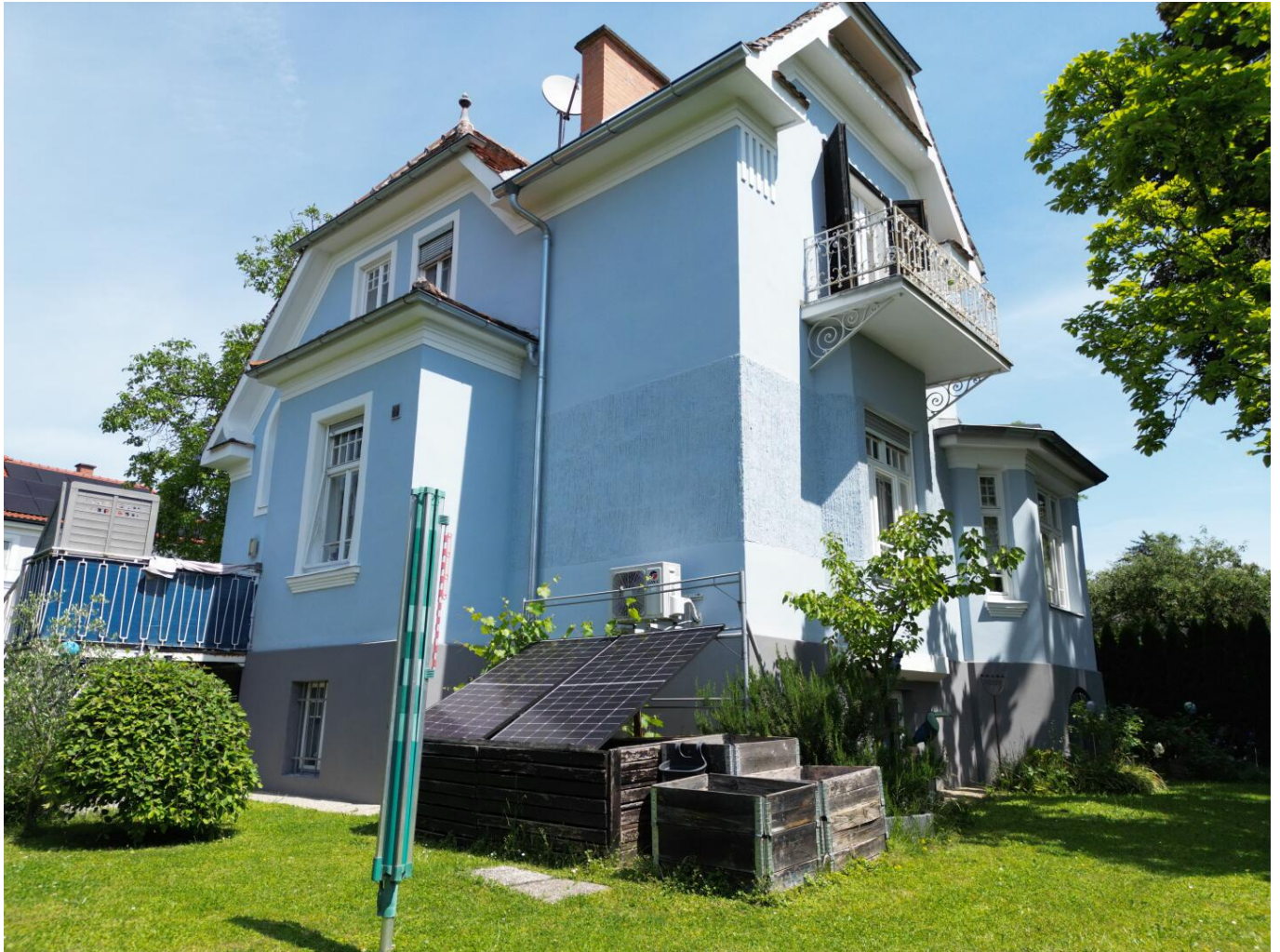
A 1.4 Außenansicht