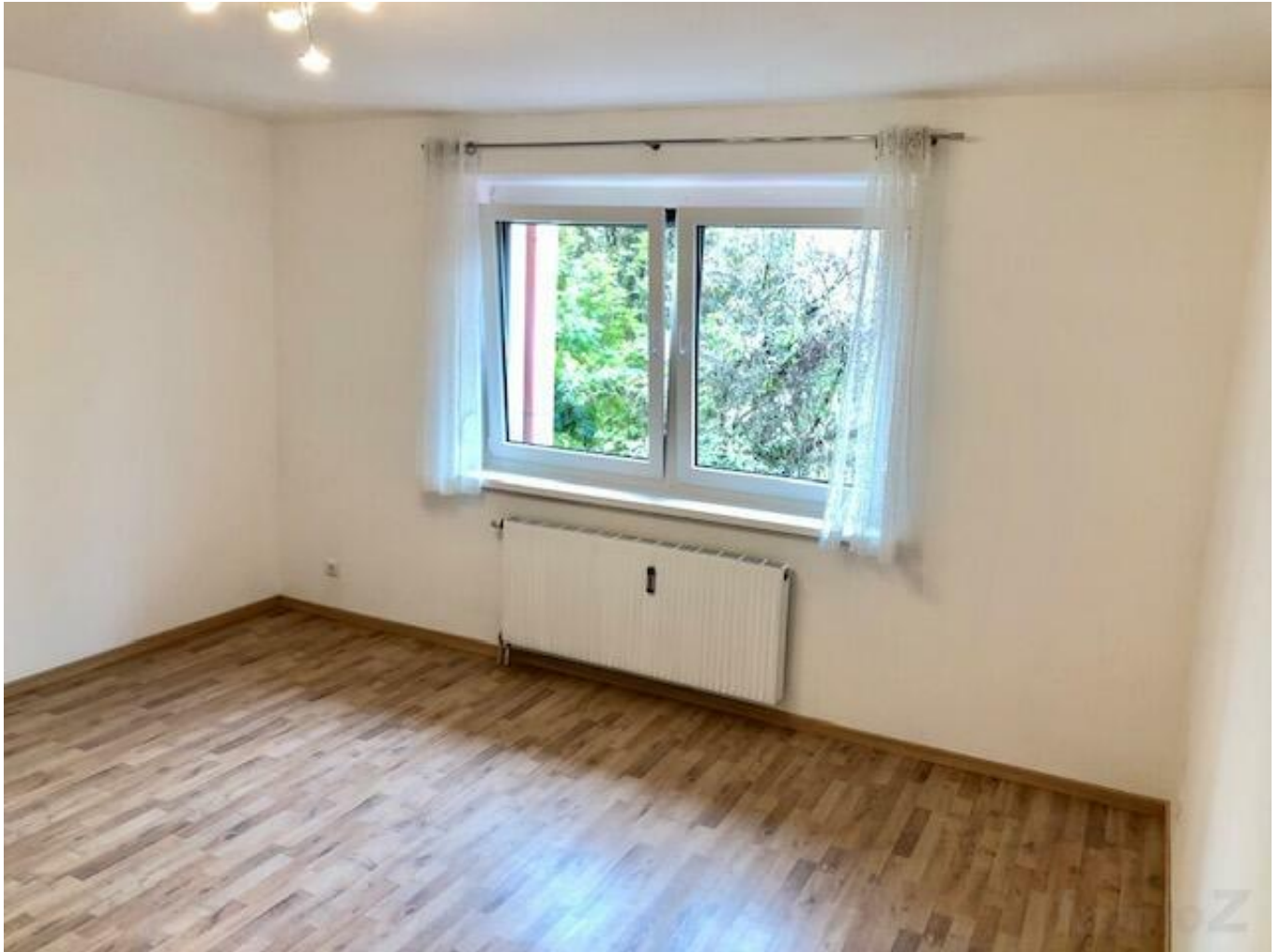
Wohn-Schlafbereich - hofseitig

gepflegte GARCONNIERE - Nähe TU + Schulzentrum St. Peter im 1.OG. - ab sofort beziehbar!