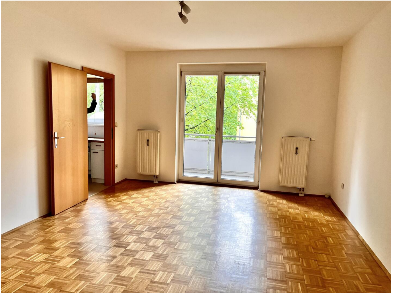
Wohn-Schlafräum mit Zugang zur Küche und Ausgang auf den Balkon