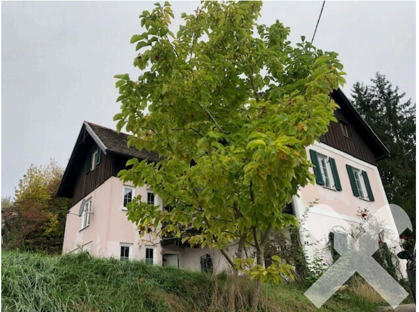
Großzügiges Haus mit Seeblick