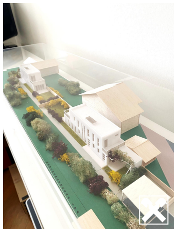
2 EFH PETRONELL - BRUCKERSTRASSE 18a