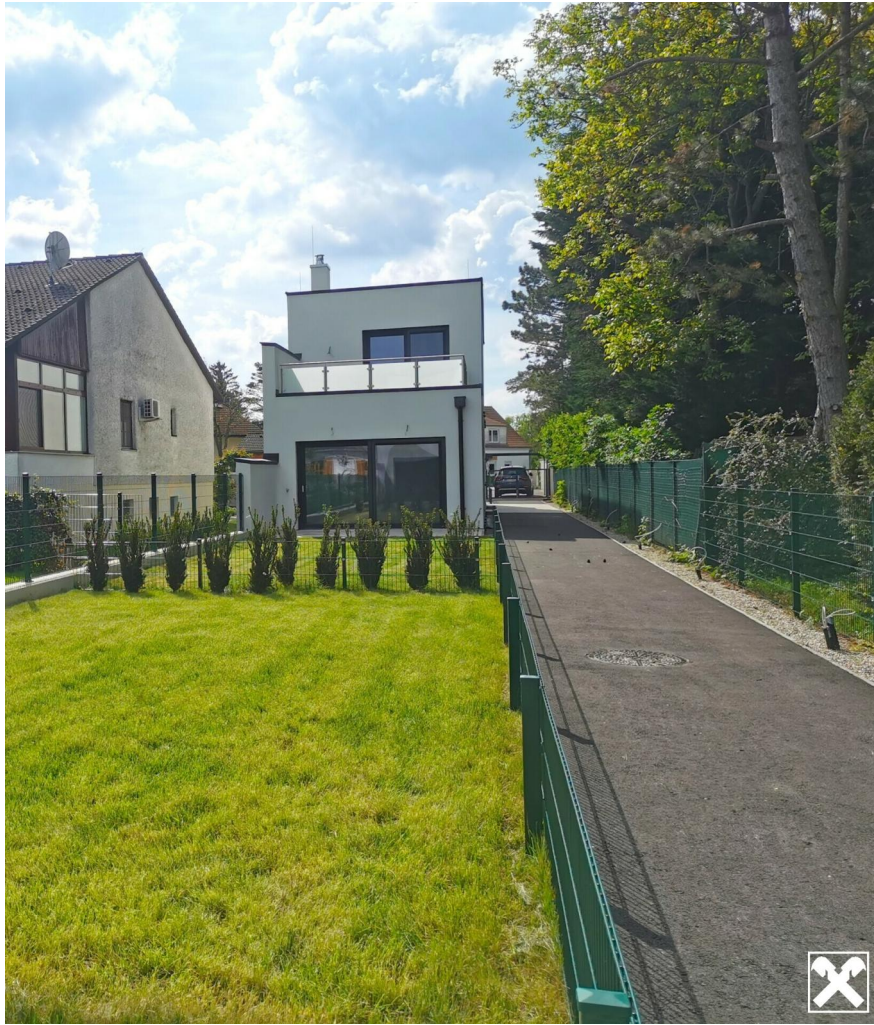
2 EFH PETRONELL - BRUCKERSTRASSE 18a