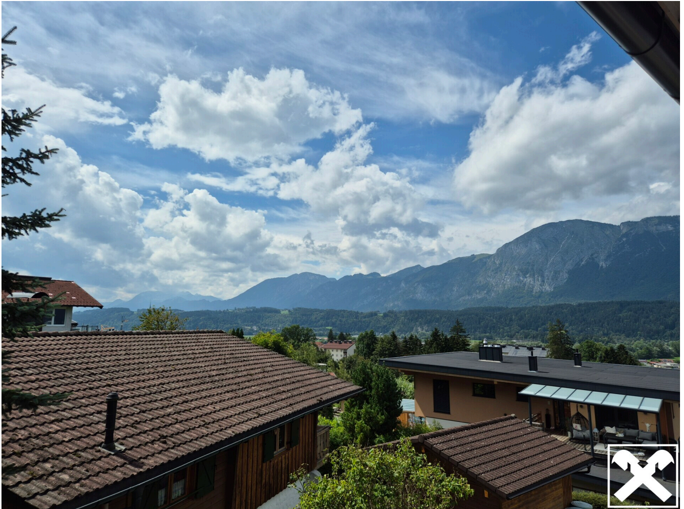
Top 3 Aussicht West