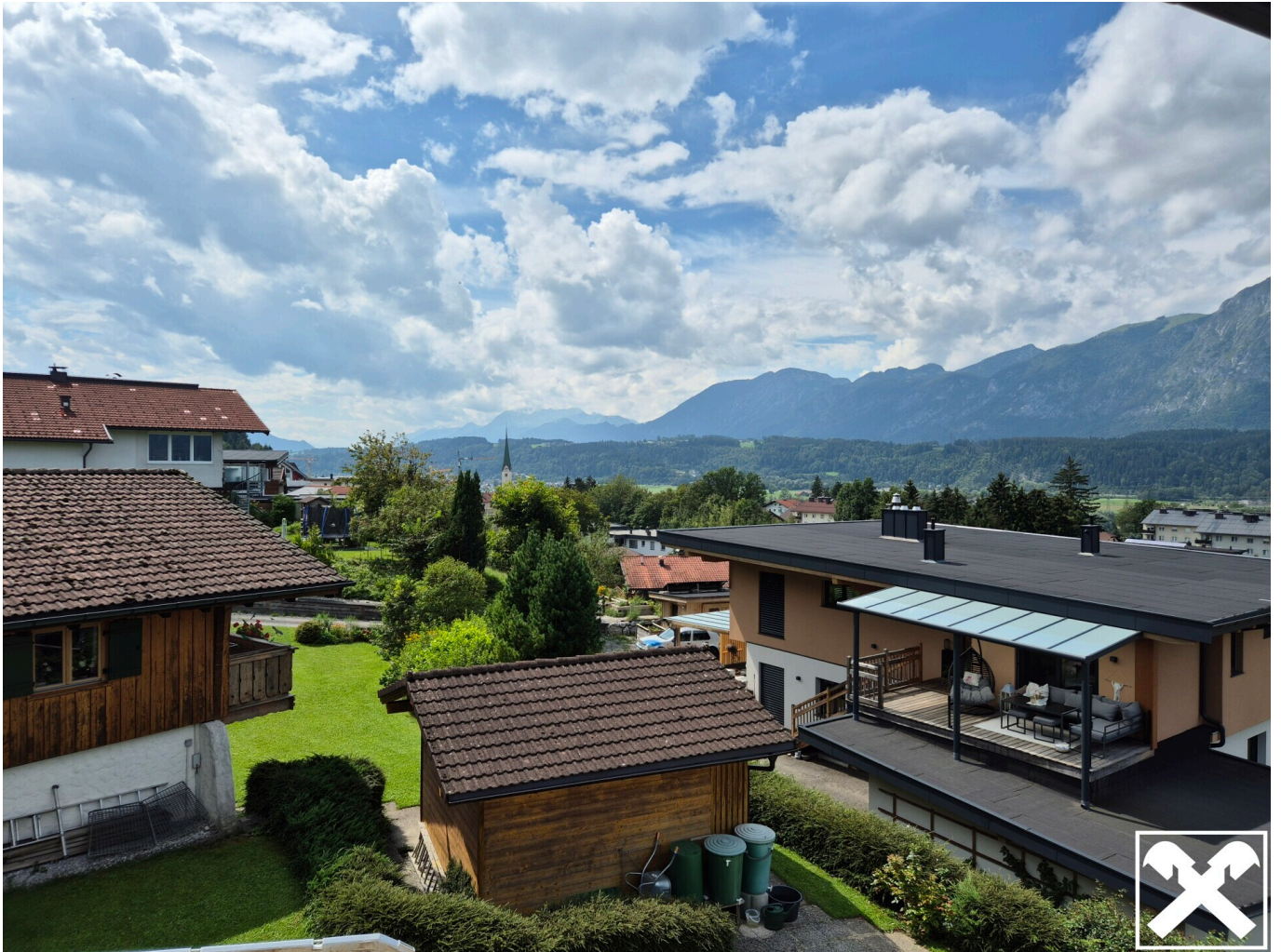
Top 4 Aussicht West