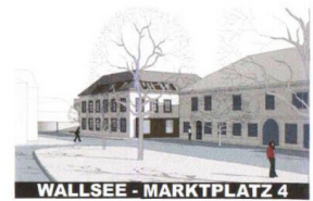
WALLSEE - MARKTPLATZ 4