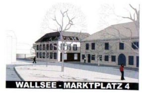
TOP 4 1. Obergeschoss

COMFORT IMMOBILIEN BY S&G BETEILIGUNGEN GMBH