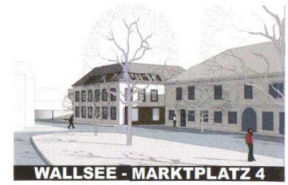
WALLSEE - MARKTPLATZ 4