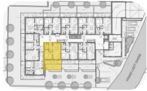
LAGEPLAN ERDGESCHOSS M 1:800

WOHNNUTZFLÄCHE 52.59m 2 TERRASSE 11.43m 2 EIGENGARTEN 20.41m 2 ABSTELLRAUM 2.28m 2 KELLERABTEIL 4.72m 2