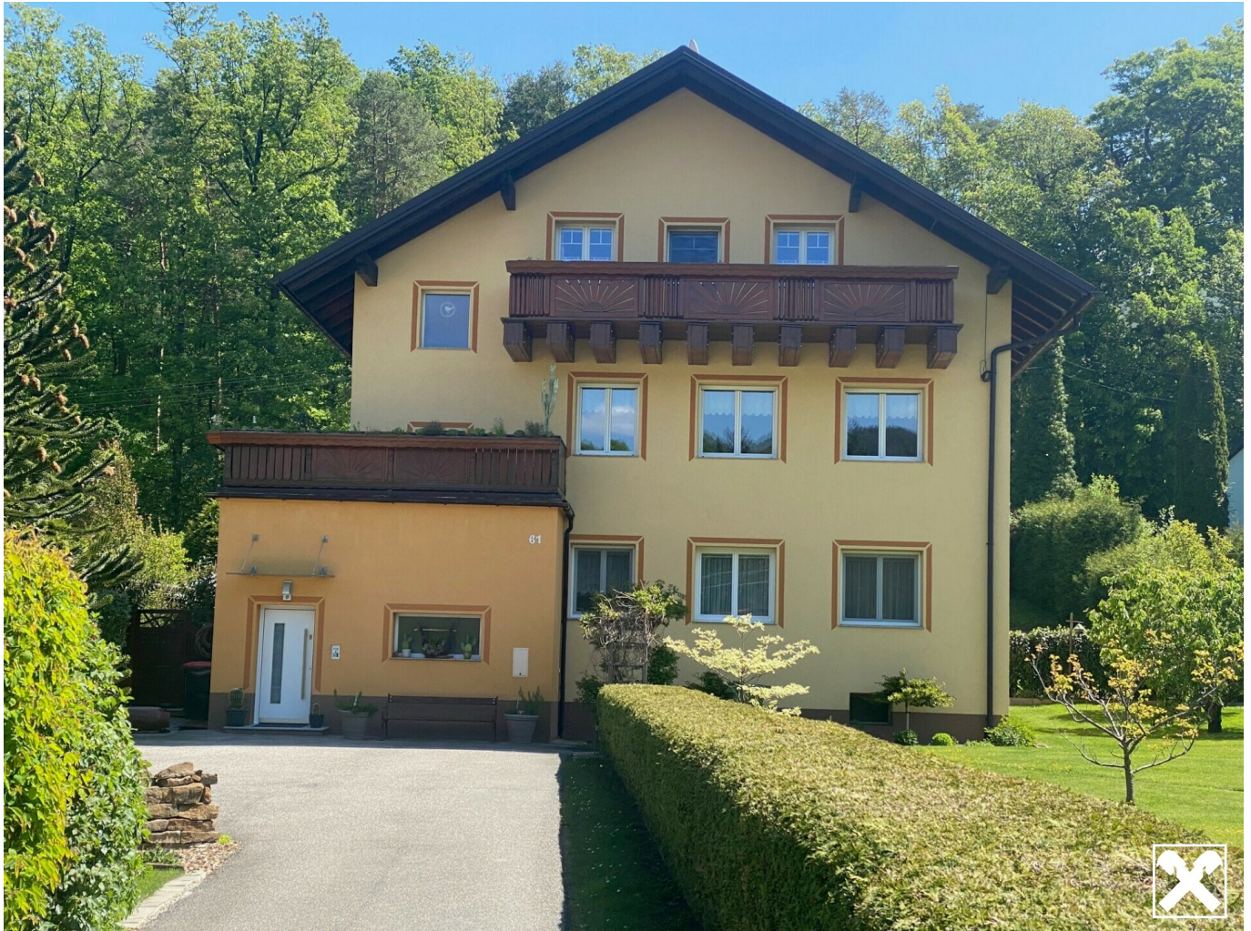
Hausfront, Eingang - Wohnung Balkon