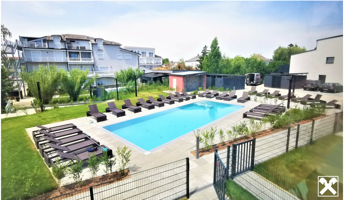
Pool Hell Aussen