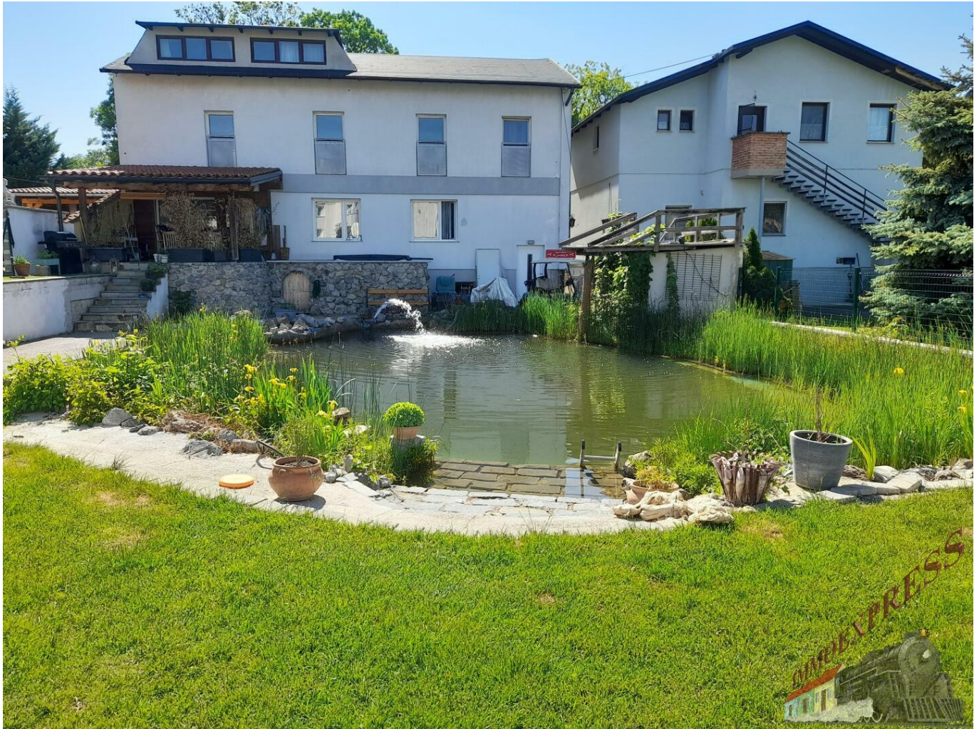
Garten mit Teich

Objektnummer: O2100160880 Eine Immobilie von Immoexpress KG