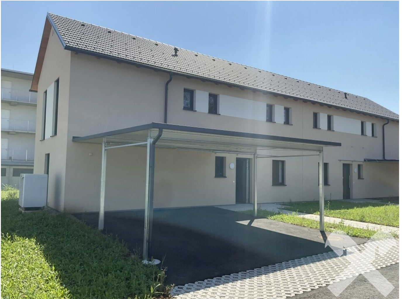
DHH mit Carport