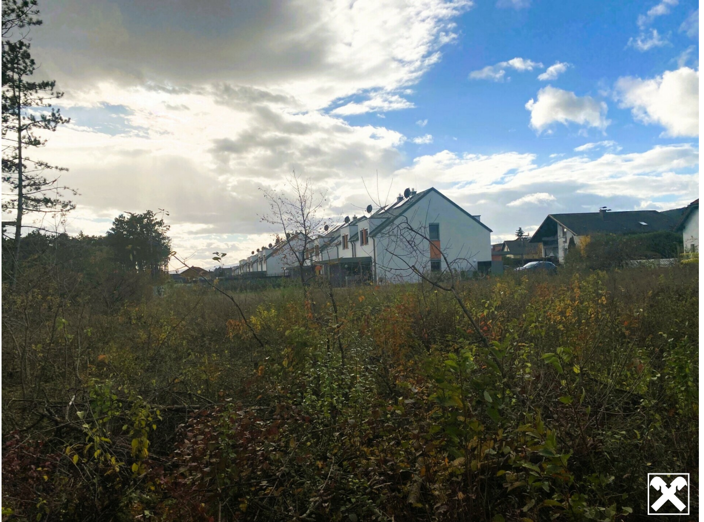
Aussicht nach Westen, Reihenhausanlage