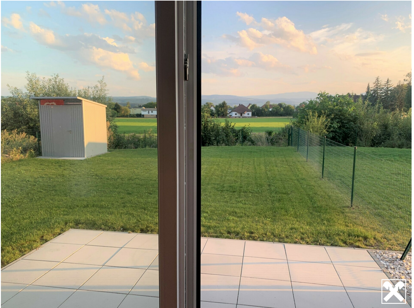
Fernsicht über die Felder