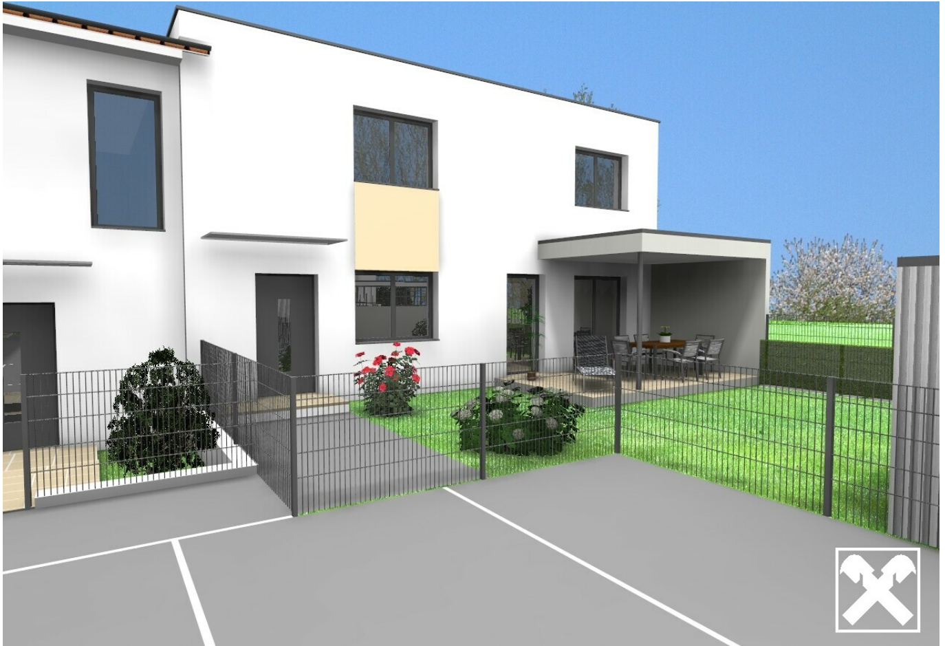
Garten Haus 6