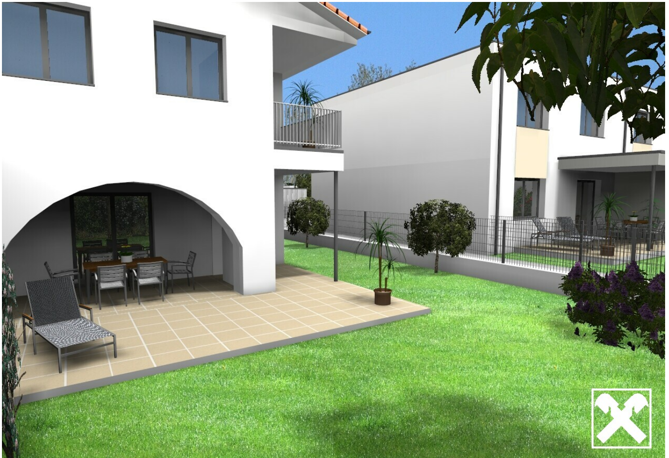
Terrasse Haus 5