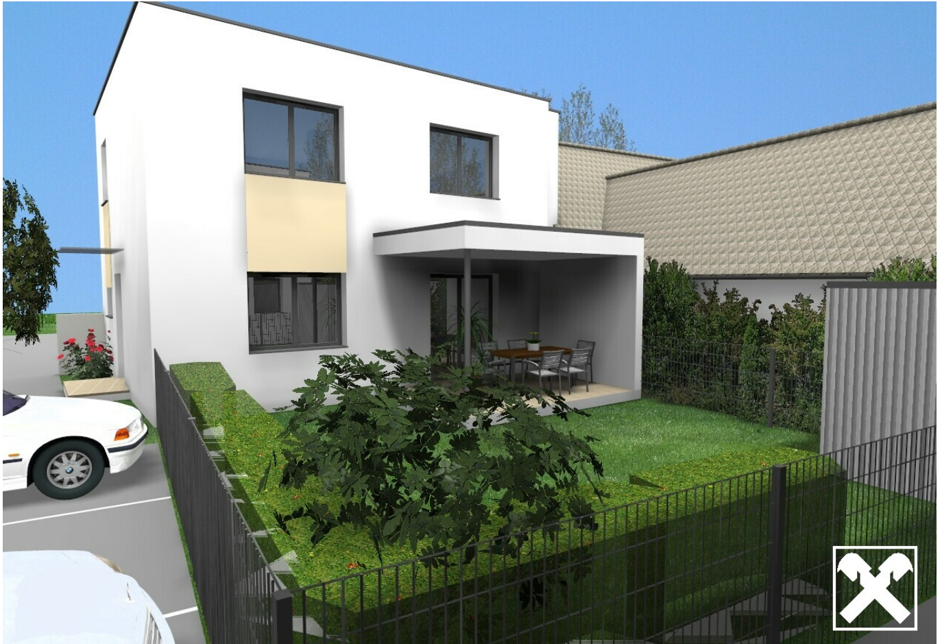
Garten Haus 1