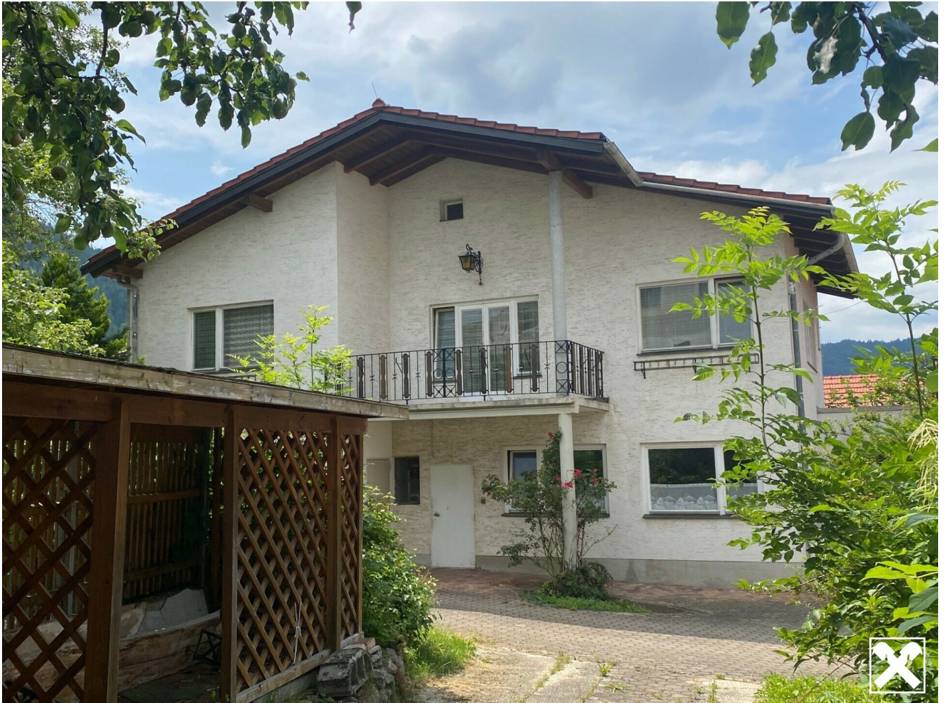
Front neues Haus