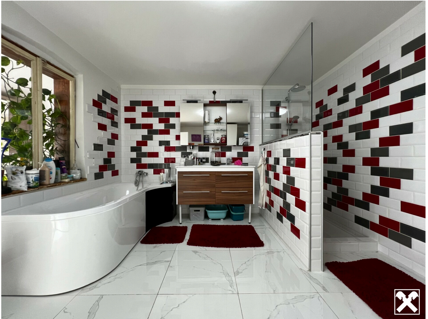
Badezimmer mit Wanne & Dusche