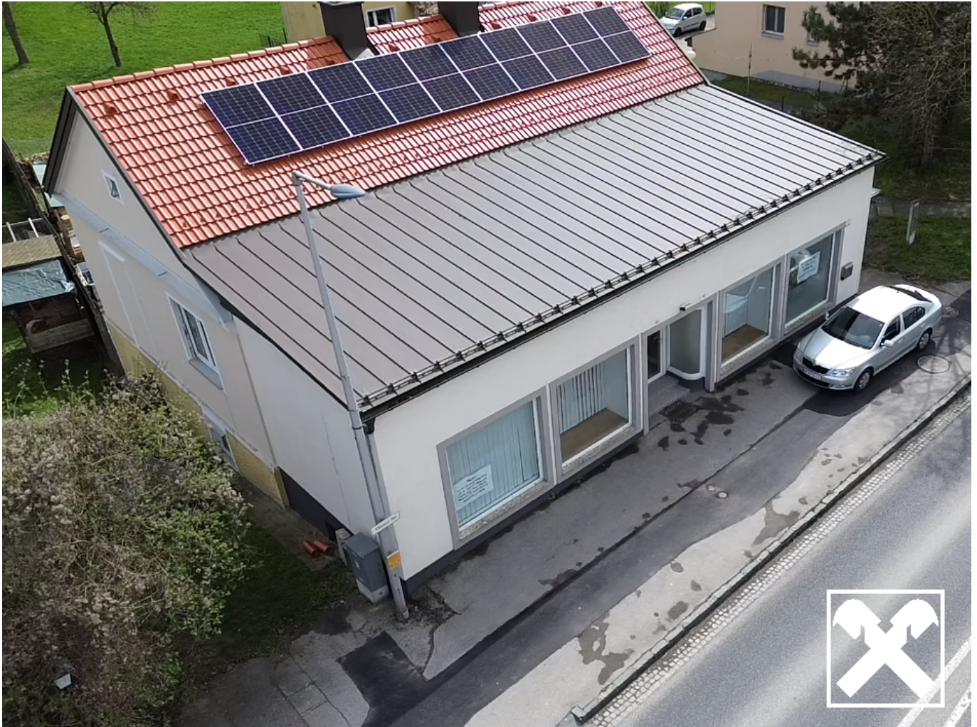
Aussenaufnahme Drohne Geschäft