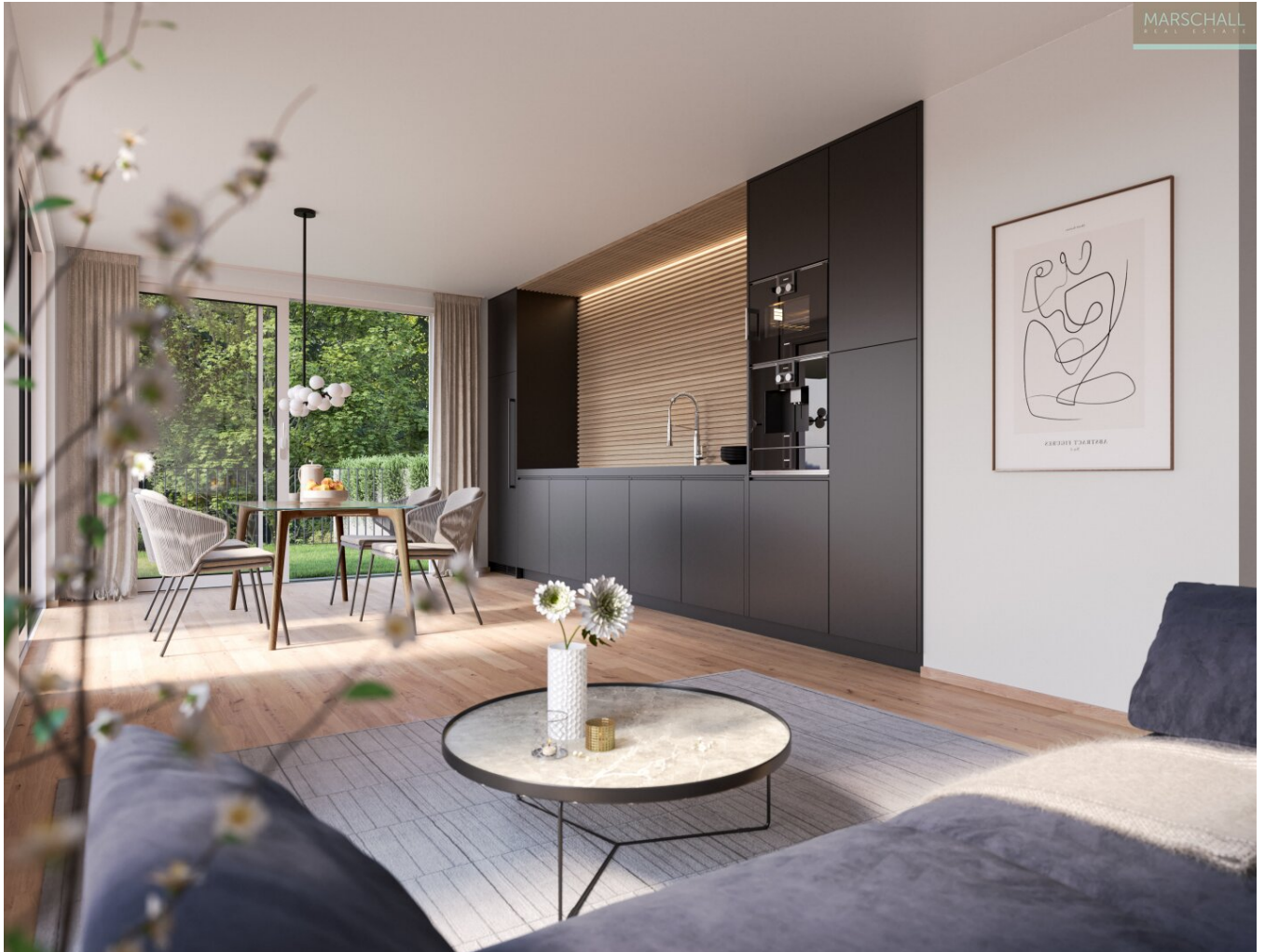
Wohnzimmer / Küche Symbolbild