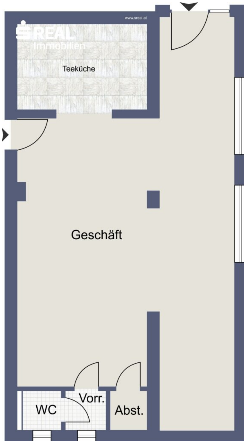
Skizze Top 1