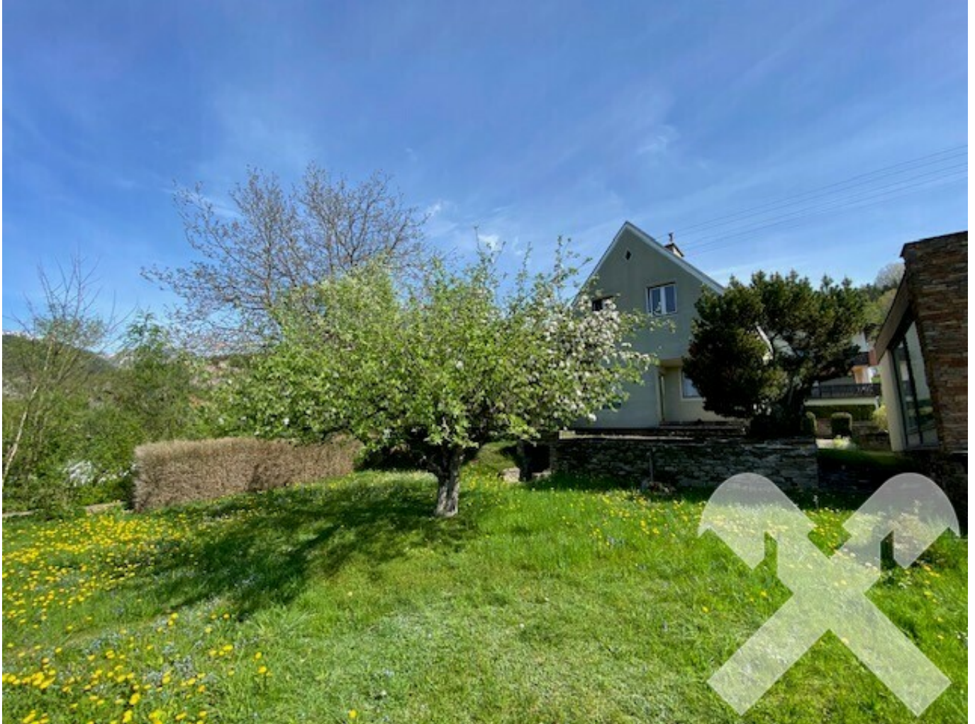
Haus Rückseite und Grundstück