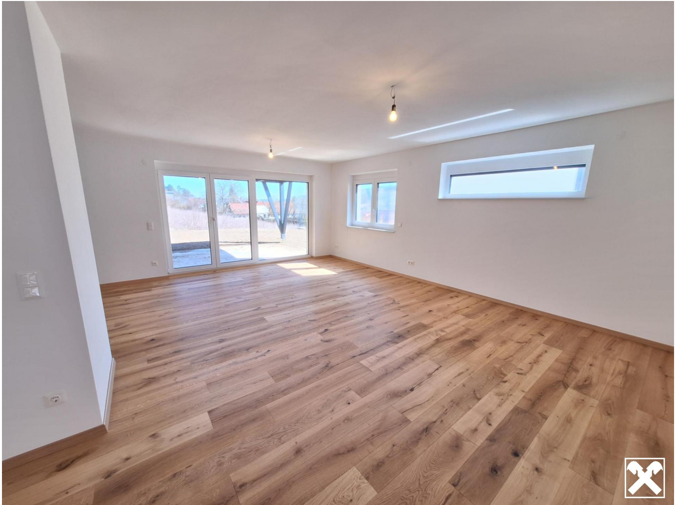
EG - Wohnbereich