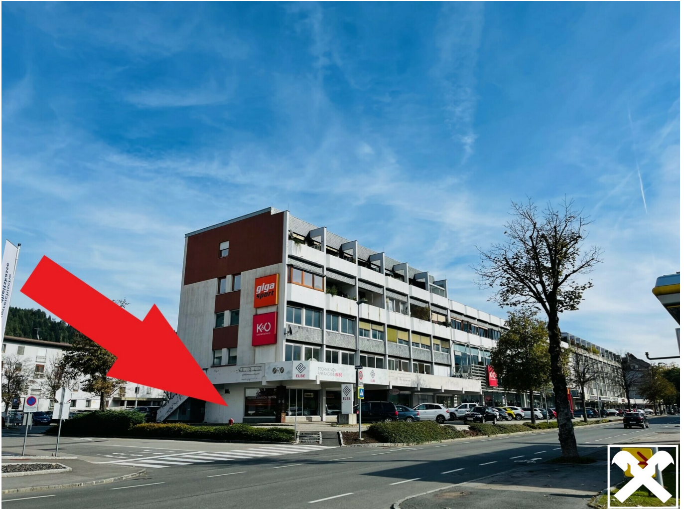
Gebäude mit Situierung