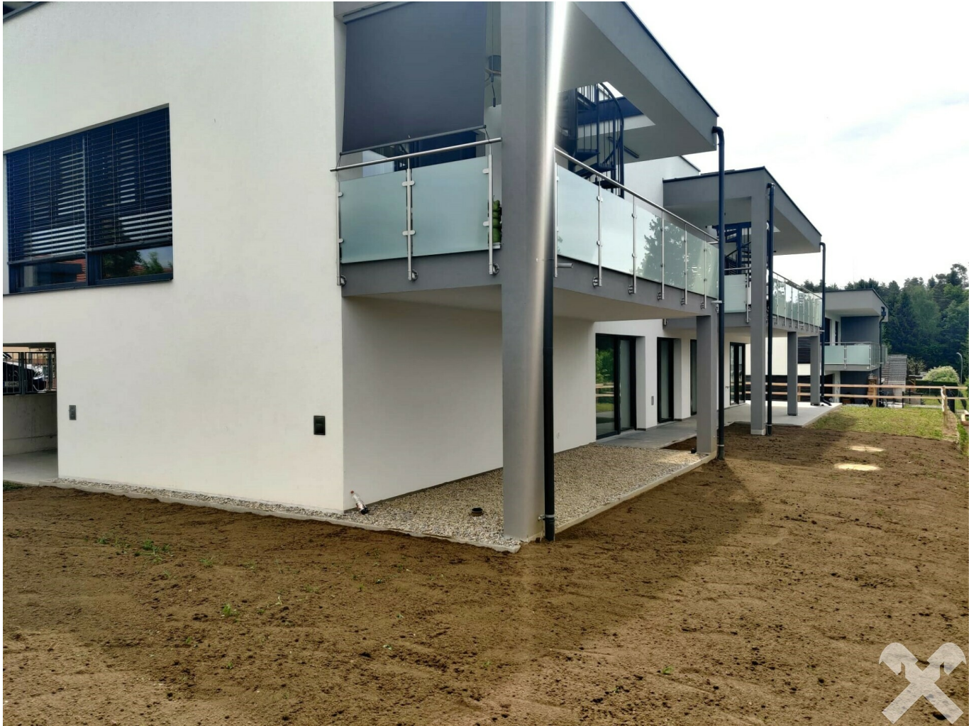
Gartenwohnung Top 1 - Greenlounge Wohnpark Lieboch