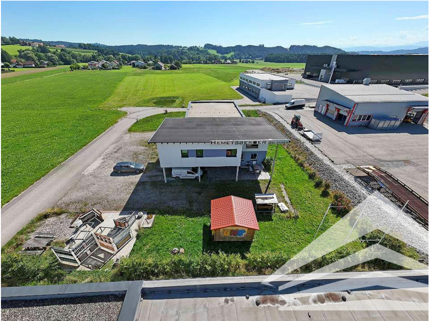
Drohnen Aufnahme Betriebsliegenschaft