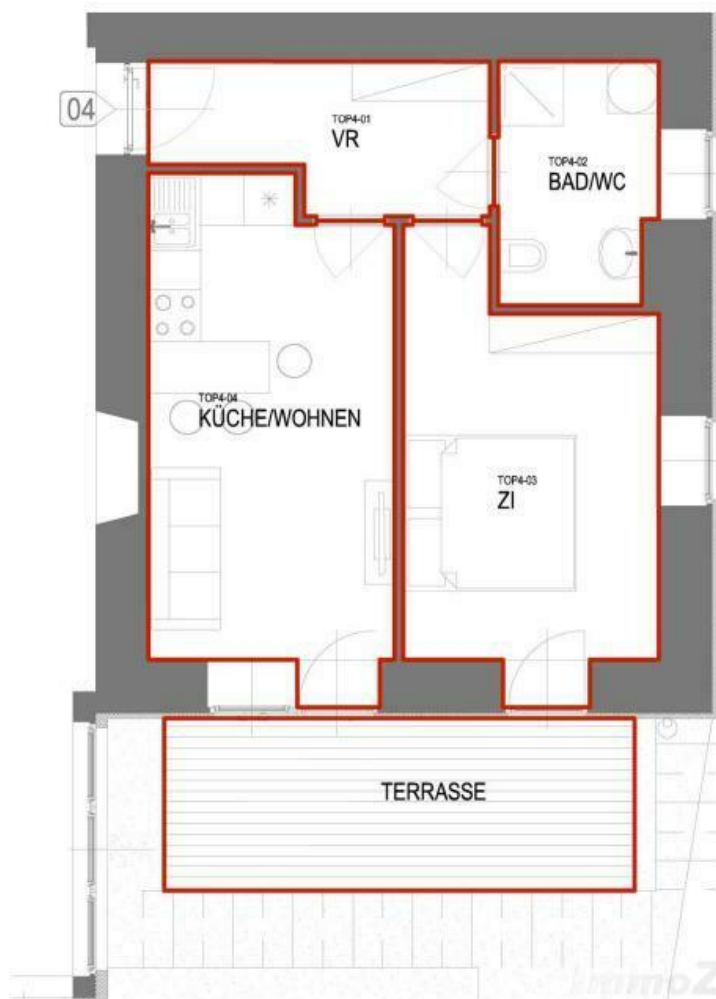
Top 4, im EG