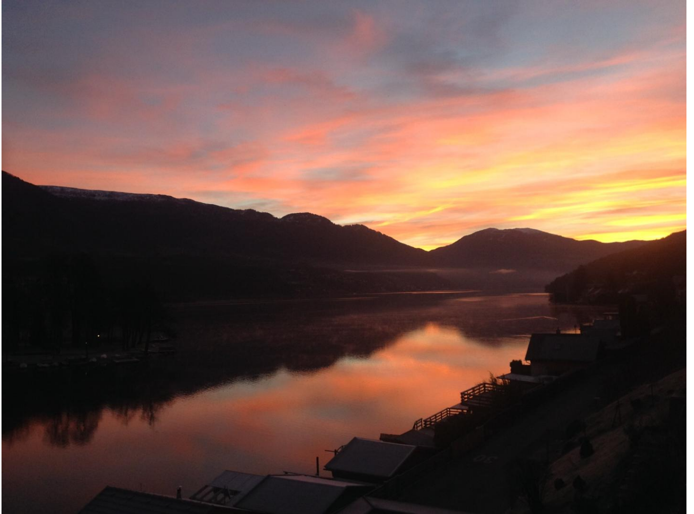
Ausblick von der großzügigen Terrasse