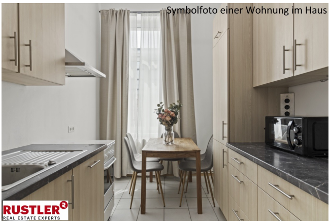
Symbolfoto einer Wohnung im Haus