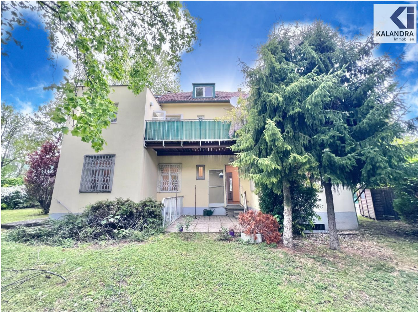
Haus & Garten