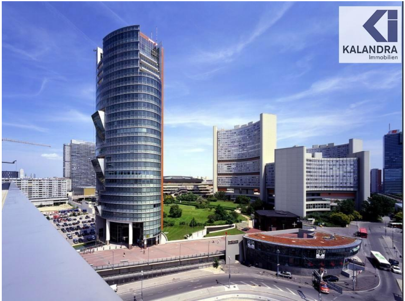
Andromeda Tower 3