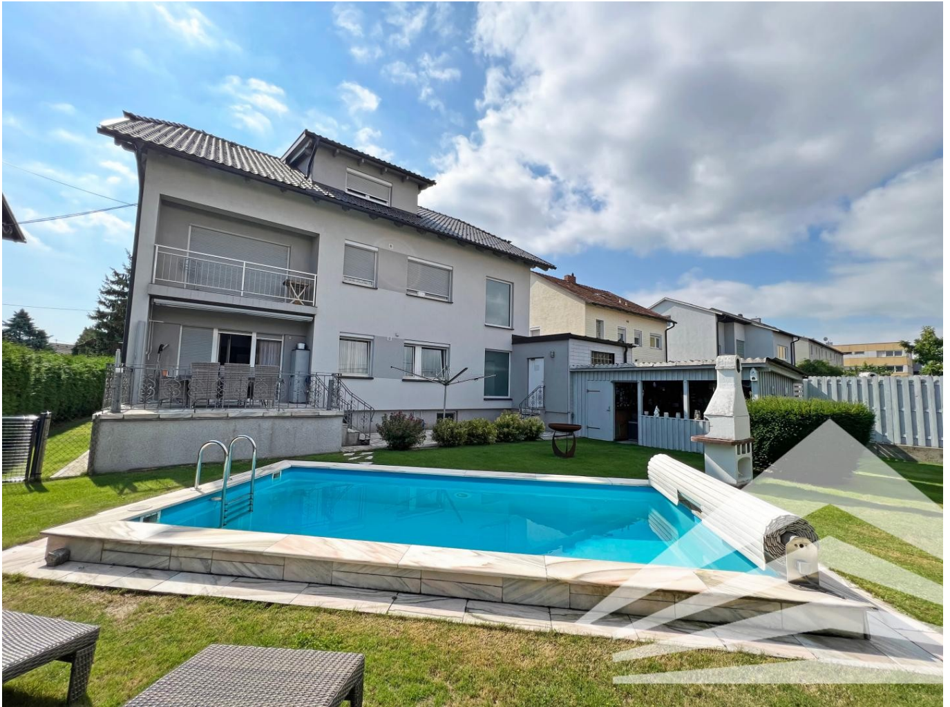
Terrasse | Garten | Ansicht Gartenseite