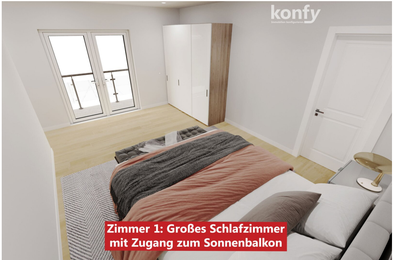
Zimmer 1: Großes Schlafzimmer mit Zugang zum Sonnenbalkon