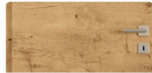
RÖHRENSPAN | Eiche