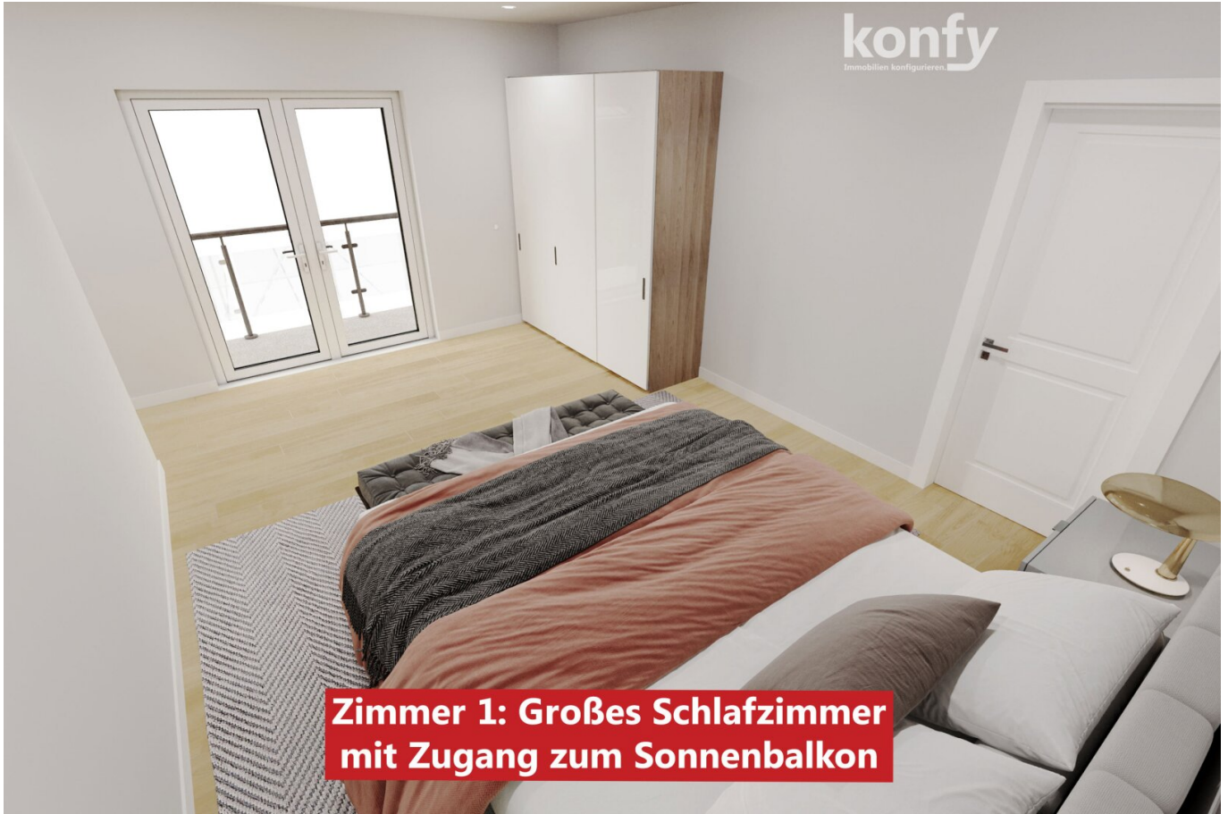
Zimmer 1: Großes Schlafzimmer mit Zugang zum Sonnenbalkon