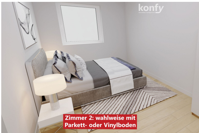
Zimmer 2: wahlweise mit Parkett- oder Vinylboden