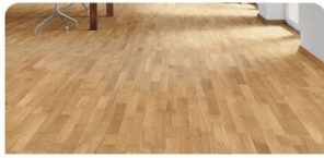
PARKETT | Eiche