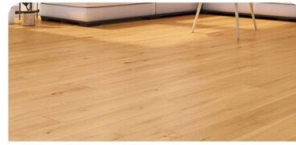
VINYL | Classen