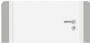
INNENTÜR | Weiß