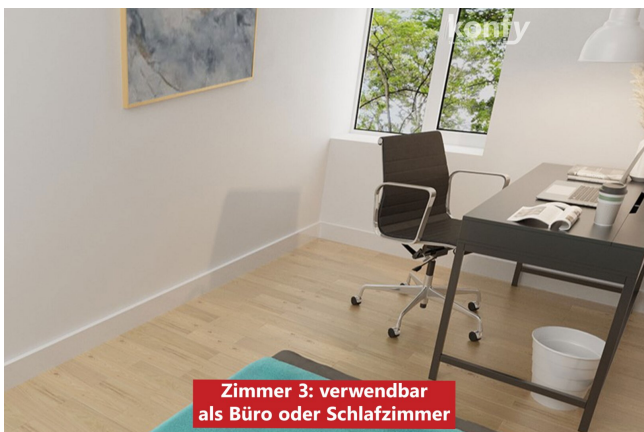
Zimmer 3: verwendbar als Büro oder Schlafzimmer