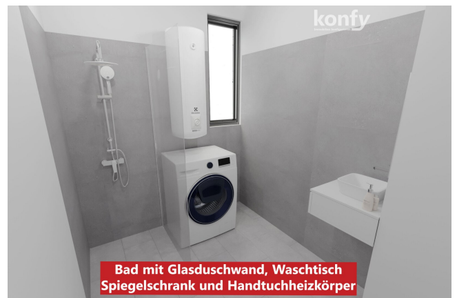
Bad mit Glasduschwand, Waschtisch Spiegelschrank und Handtuchheizkörper