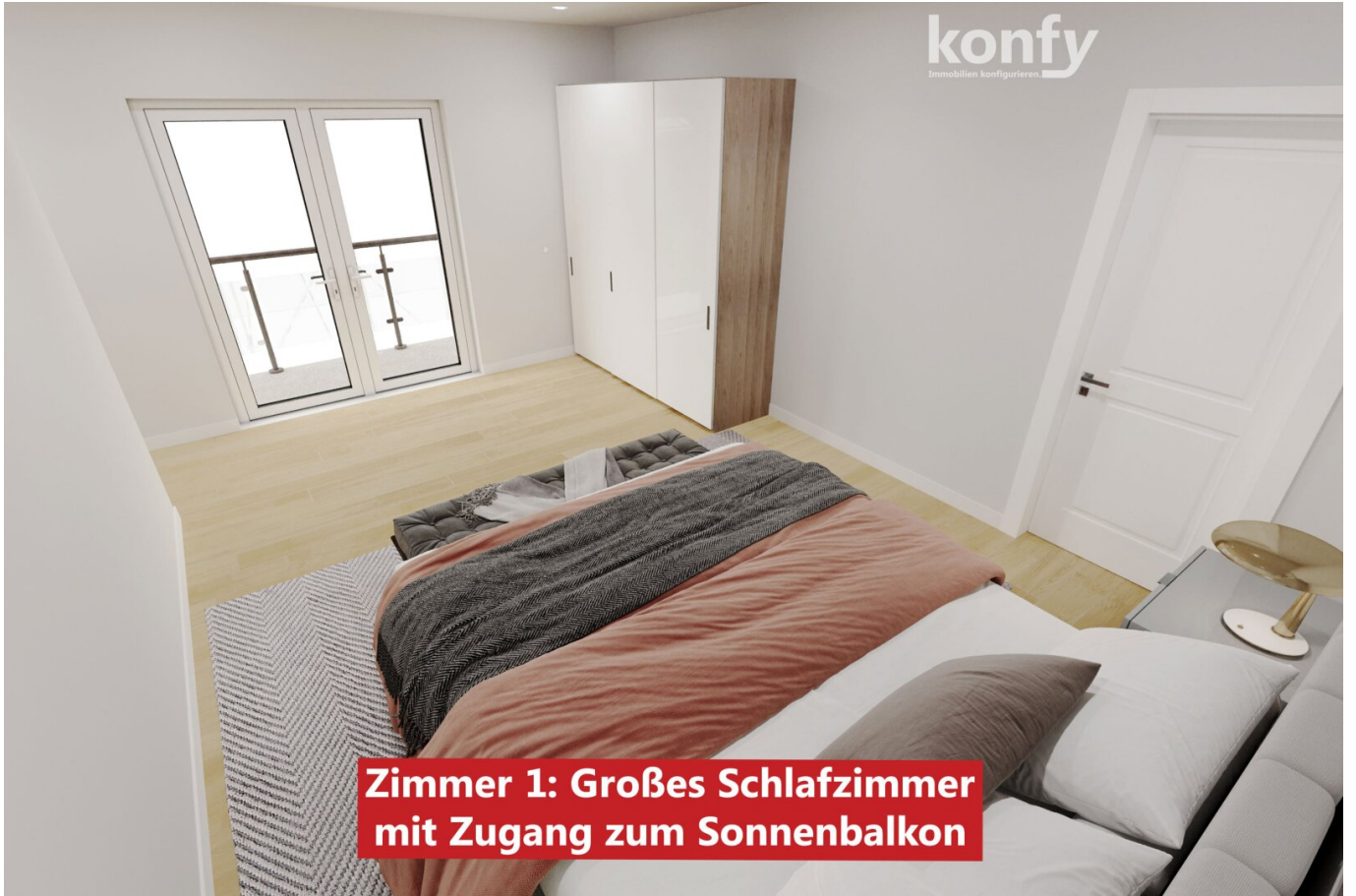
Zimmer 1: Großes Schlafzimmer mit Zugang zum Sonnenbalkon