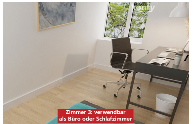
Zimmer 3: verwendbar als Büro oder Schlafzimmer