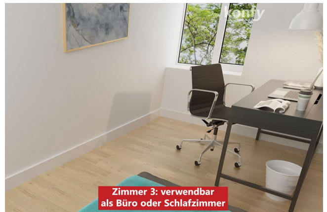
Zimmer 3: verwendbar als Büro oder Schlafzimmer