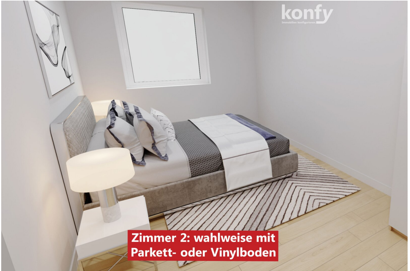
Zimmer 2: wahlweise mit Parkett- oder Vinylboden