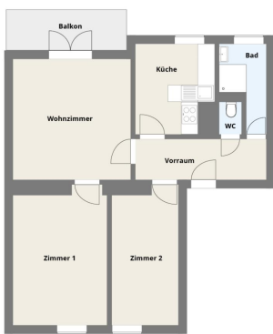
Planskizze TOP 5 | 2.OG Linke Brücke Straße 12, 4024 Linz Gesamtwohnfläche: 71,30 m 2