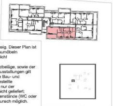
Übersichtsplan 2. OG

Sanitärgegenstände sind symbolisch dargestellt. Änderungen diesbezüglich behalten wir uns vor.