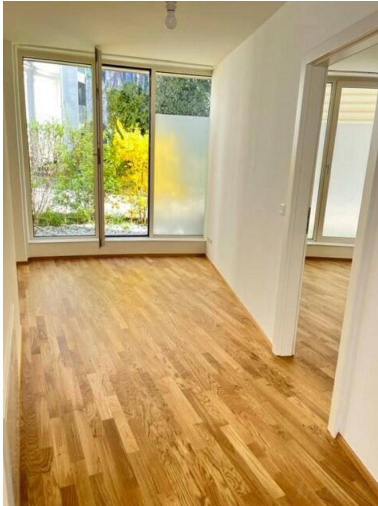
Wohn-/Essbereich mit offener Küche

Vermietet bis 4/2029- Top Lage - Besondere 3 Zimmer Wohnung, WG geeignet.