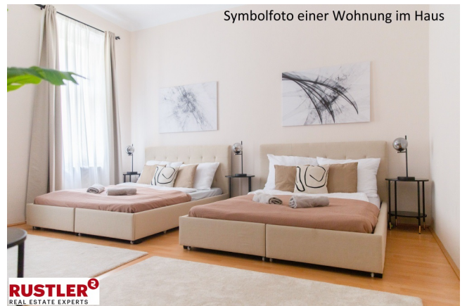
Symbolfoto einer Wohnung im Haus