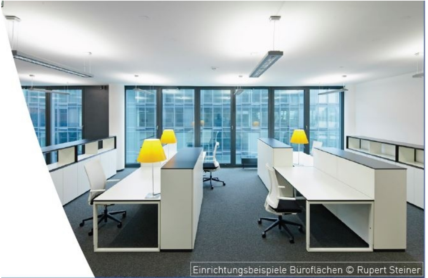
Einrichtungsbeispiele Büroflächen