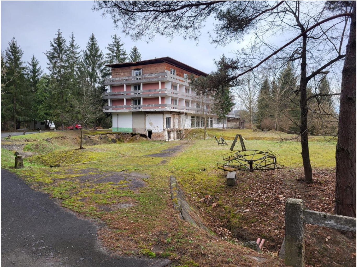
Bükkszék Hotel, Liegenschaft