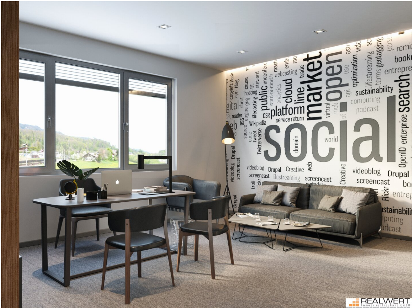
point PUCH - Beispiel Office 2