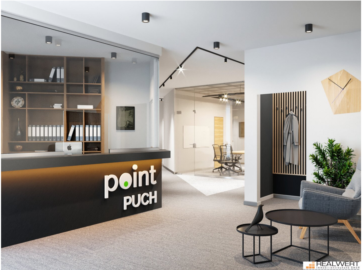
point PUCH - Beispiel Office - Ordination