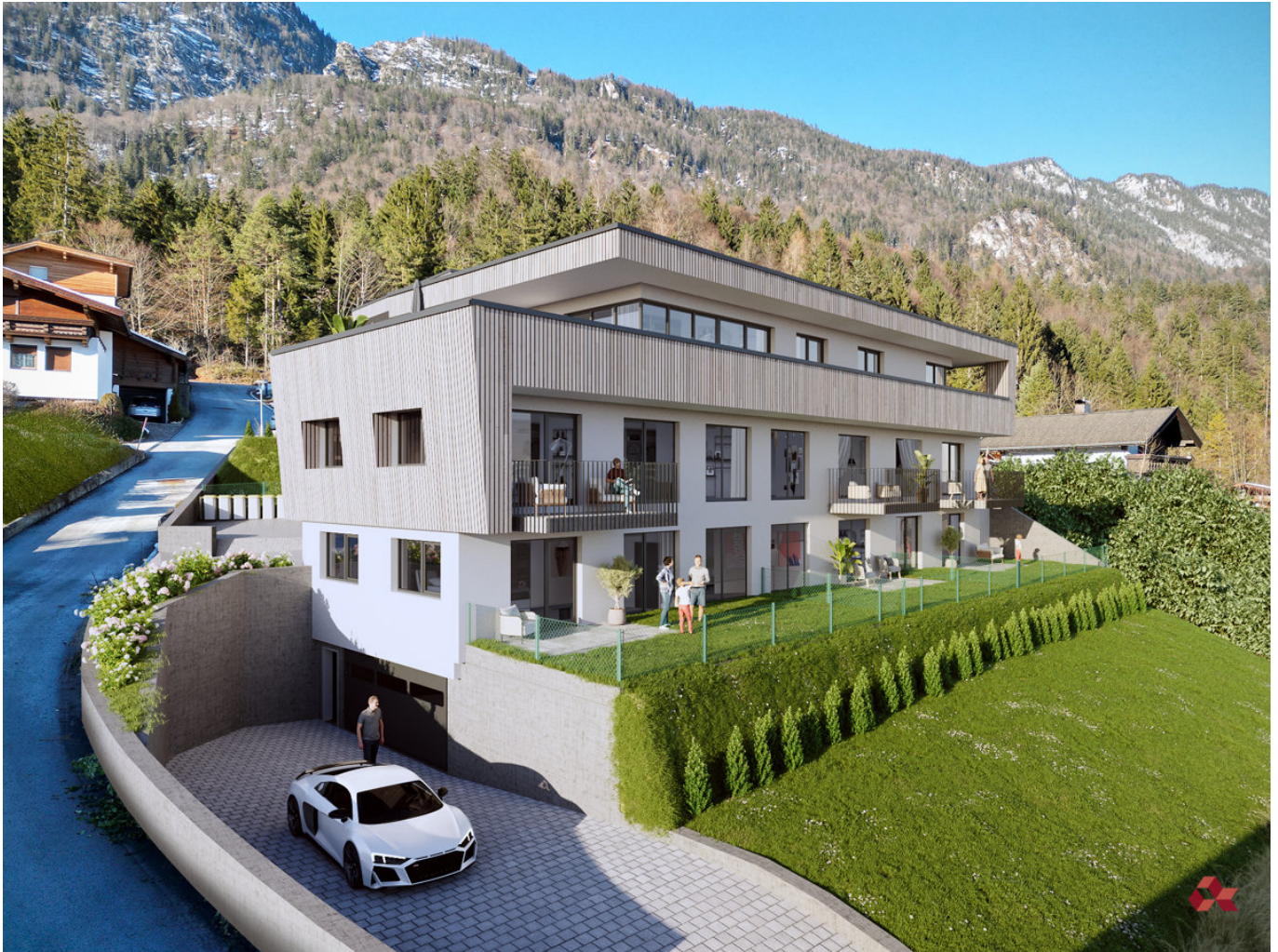
Außenansicht Süd (Visualisierung)

Objektnummer: 23K160_B301 Eine Immobilie von AlphaReal GmbH