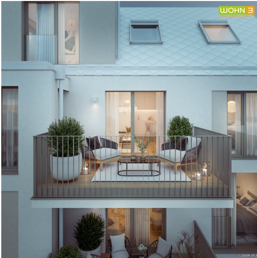
Balkon - Innenhofseitig