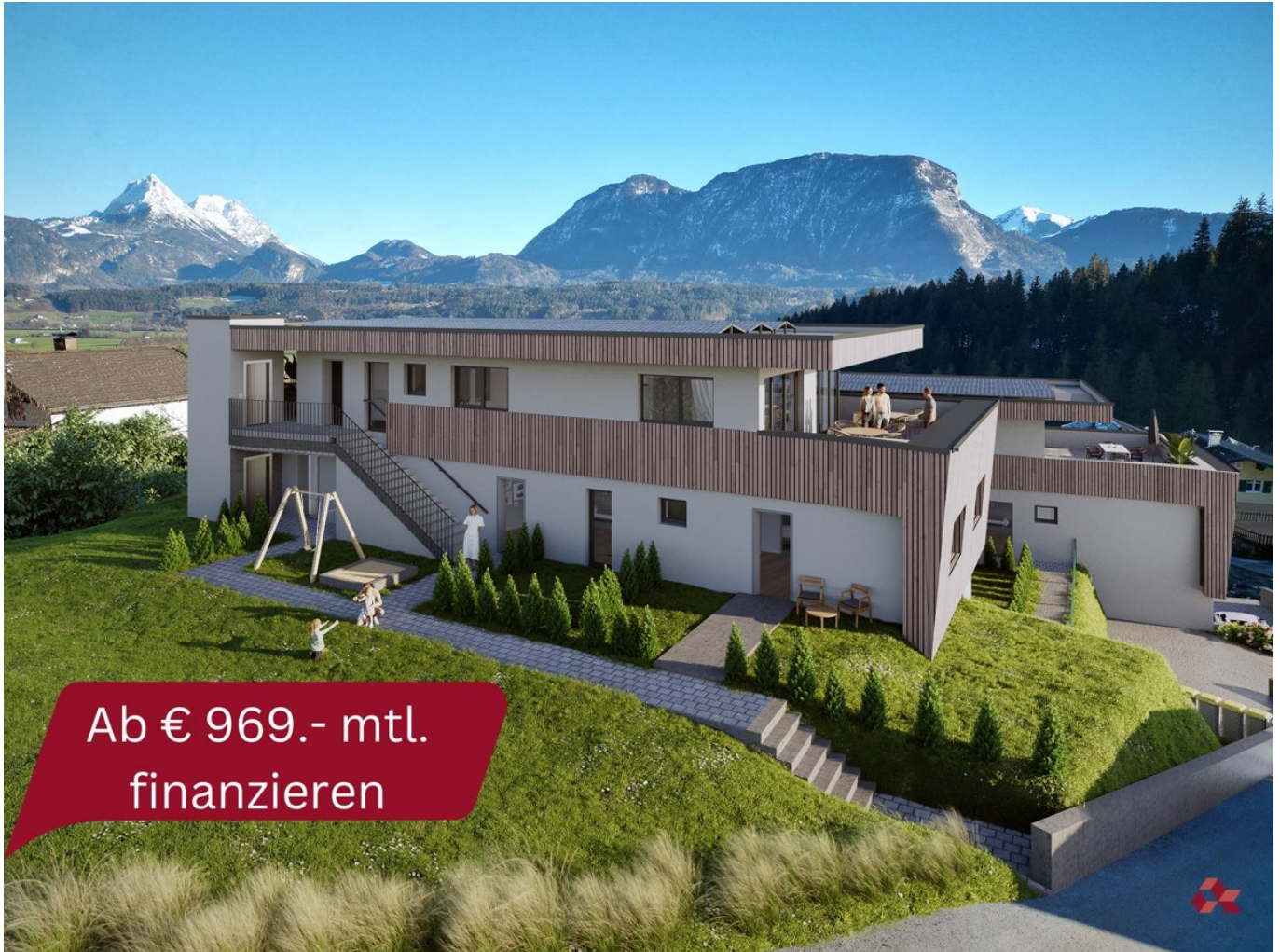
Außenansicht Nordwest (Visualisierung)

Objektnummer: 23K160_A003 Eine Immobilie von AlphaReal GmbH