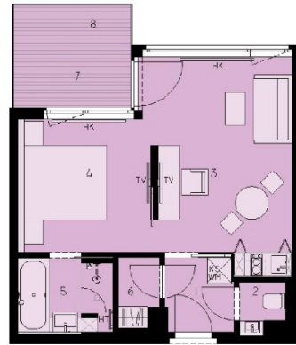
TOP 28 CA. 57,98 M 2